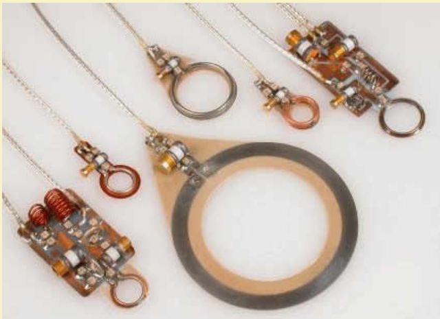
Surface coil of Doty Scientific, Inc.